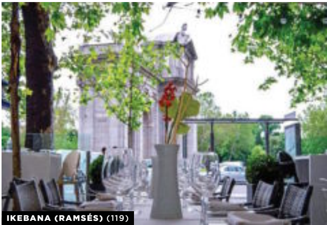
IKEBANA (RAMSÉS) (119)