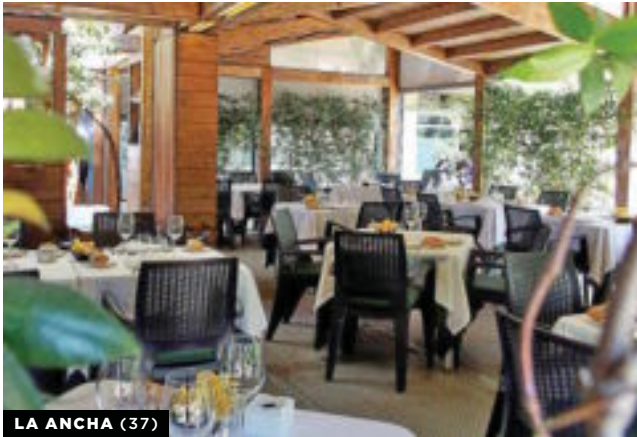
LA ANCHA (37)