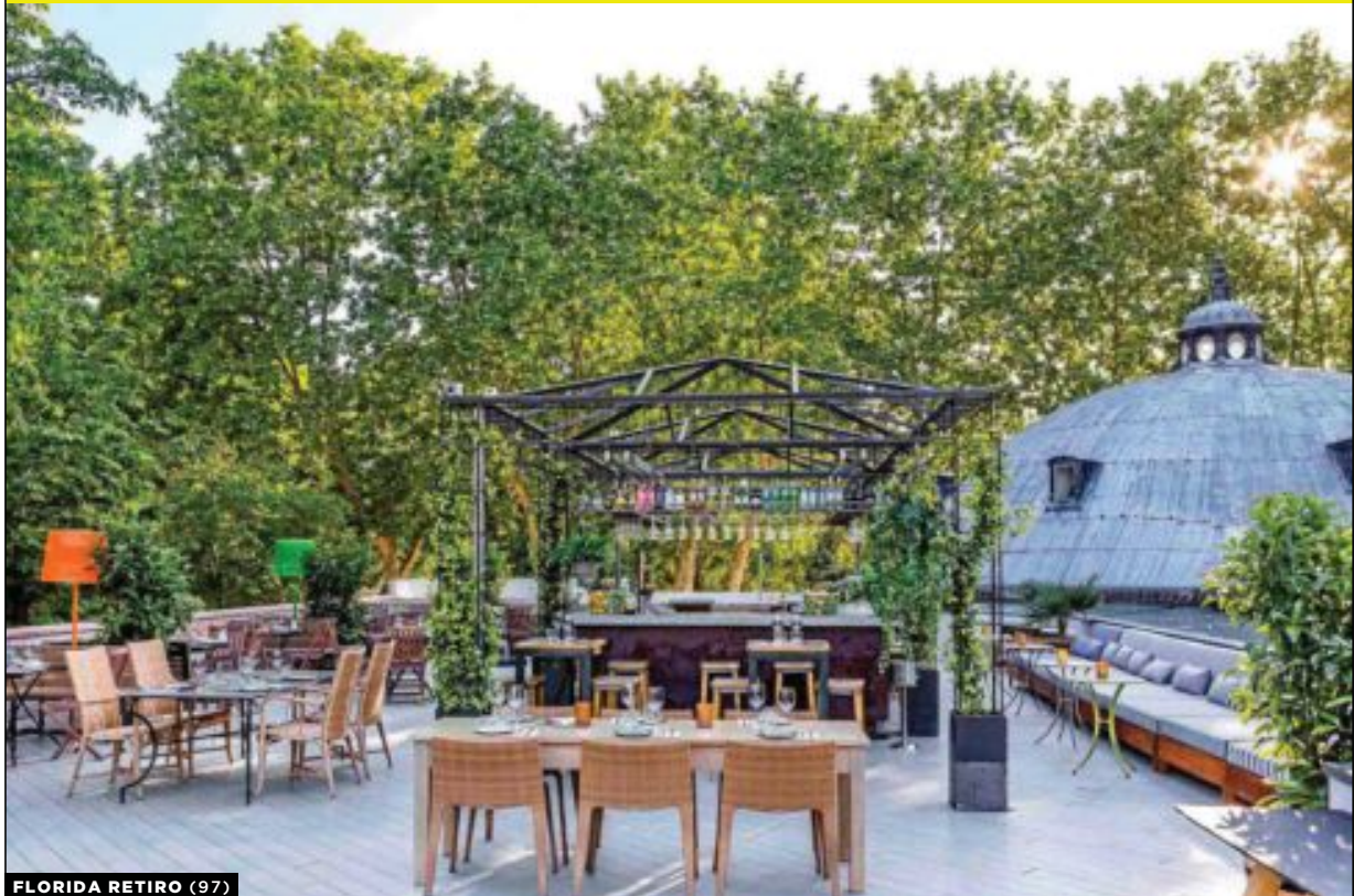
FLORIDA RETIRO (97)

EL VERANO YA ESTÁ AQUÍ Y EL TERRACEO ES UNA DE LAS MEJORES FORMAS DE SOBRELLEVARLO. POR 21 AÑO CONSECUTIVO, METRÓPOLI PRESENTA SU SELECCIÓN DE TERRAZAS EN LA COMUNIDAD, CON MÁS DE 200 PROPUESTAS DE TODOS LOS ESTILOS