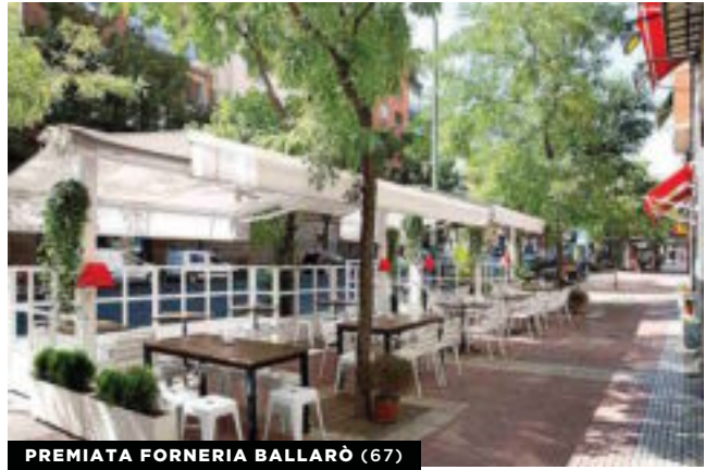
PREMIATA FORNERIA BALLARÒ (67)